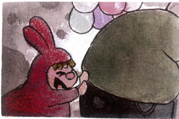
圓圓還是有一點害怕