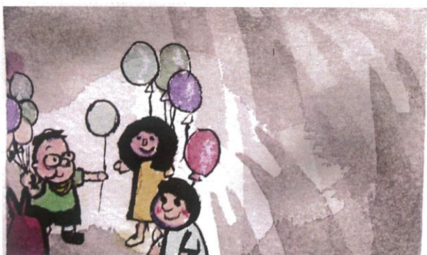
圓圓沒有那麼害怕了