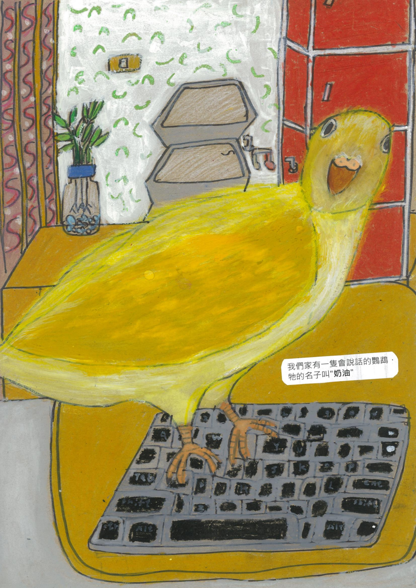
我們家有一隻會說話的鸚鵡，牠的名子叫"奶油"