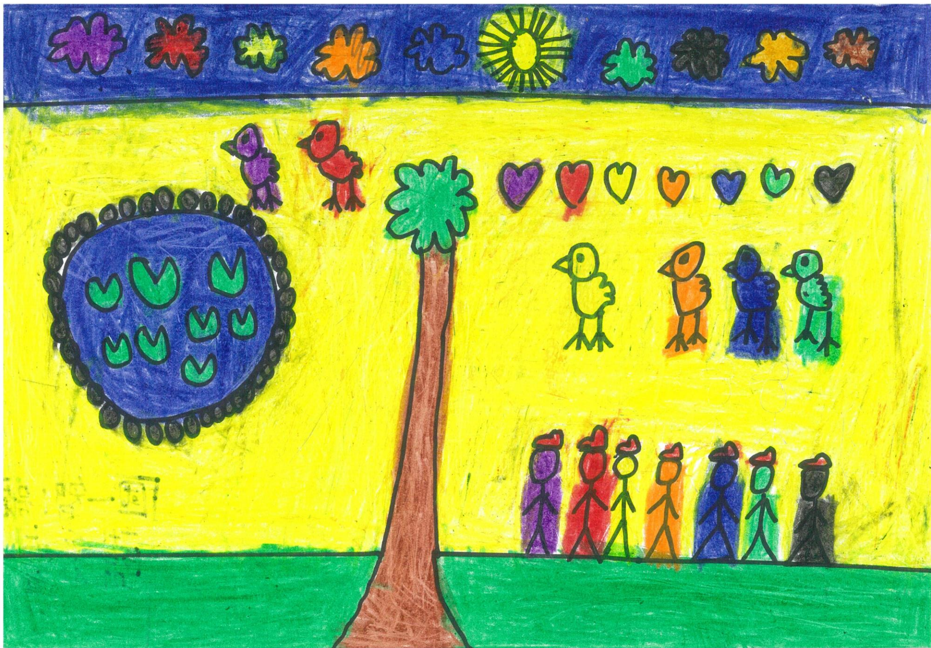
寸里的人門簾簪七彩的小雞與魚類，大夥兒一起土舌簪。