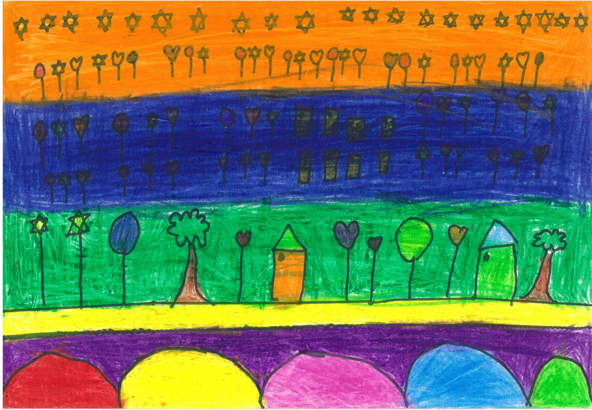
我和我的家人住在一個奇妙的小鎮上，