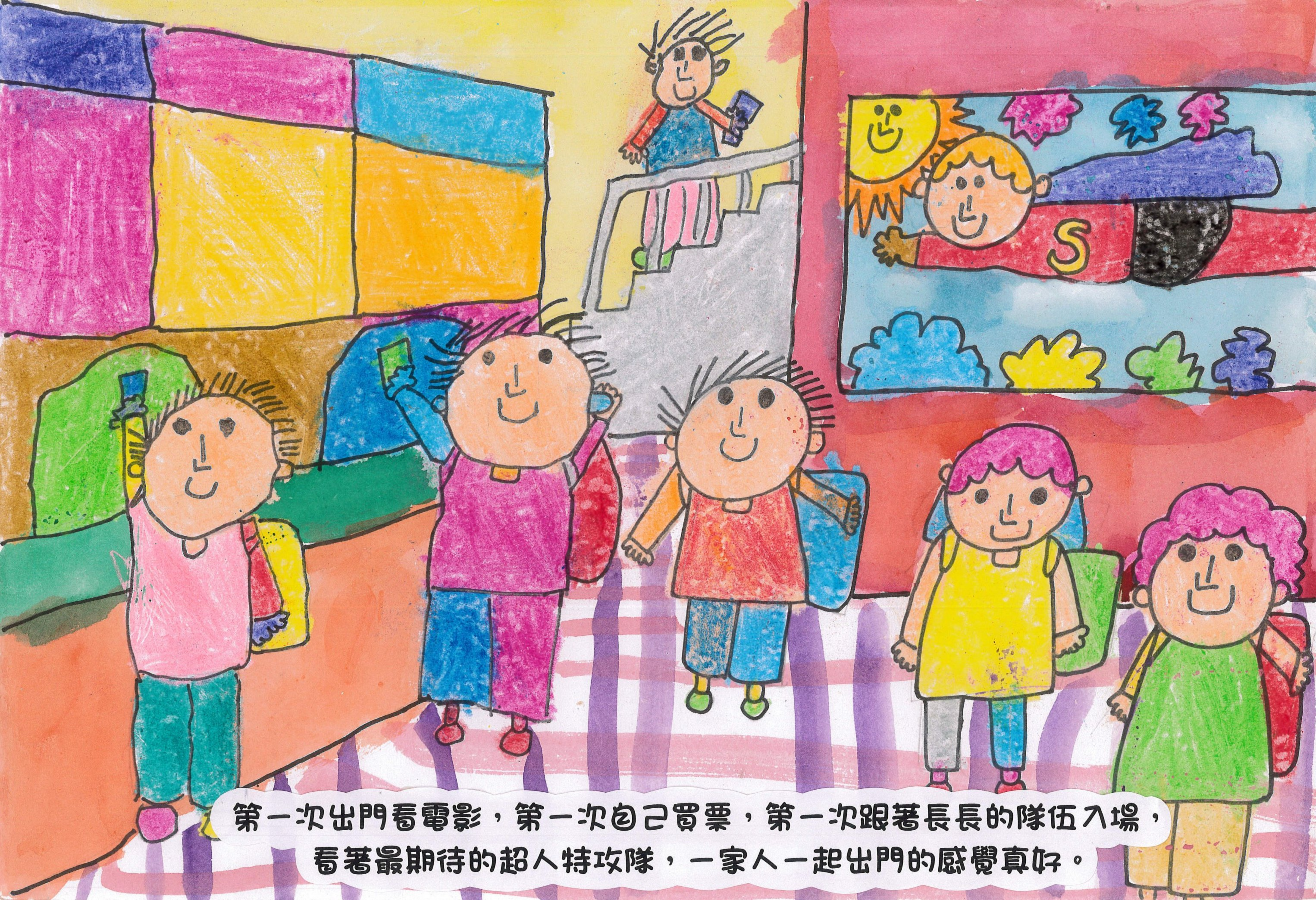
第一次出門看電影，第一次自己買票，第一次跟著長長的隊伍入場，看著最期待的超人特攻隊，一家人一起出門的感覺真好。