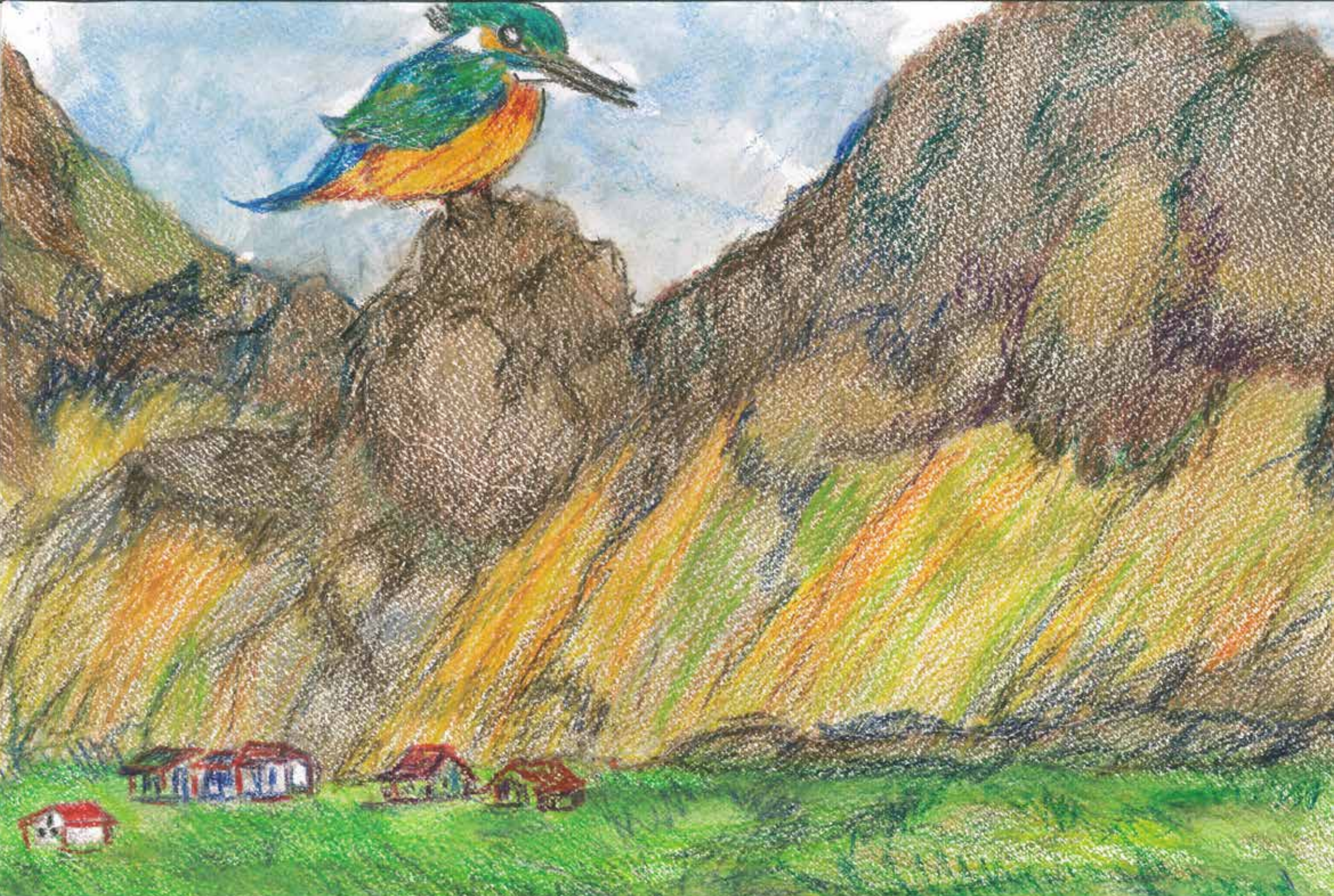
第六站，我飛到了荷蘭，高壯的山，鮮綠的草地和美麗的天空，真美。