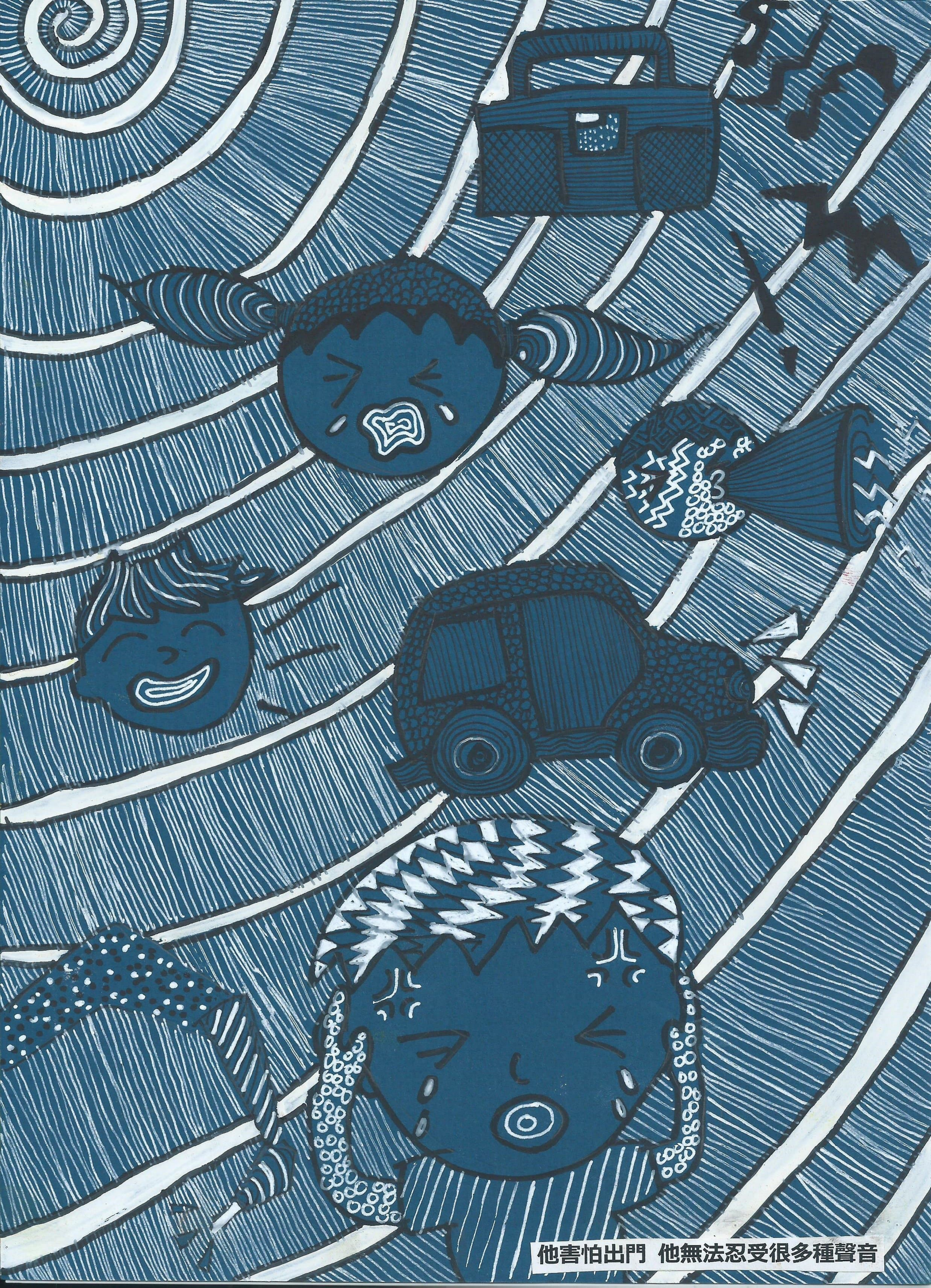
他害怕出門 他無法忍受很多種聲音