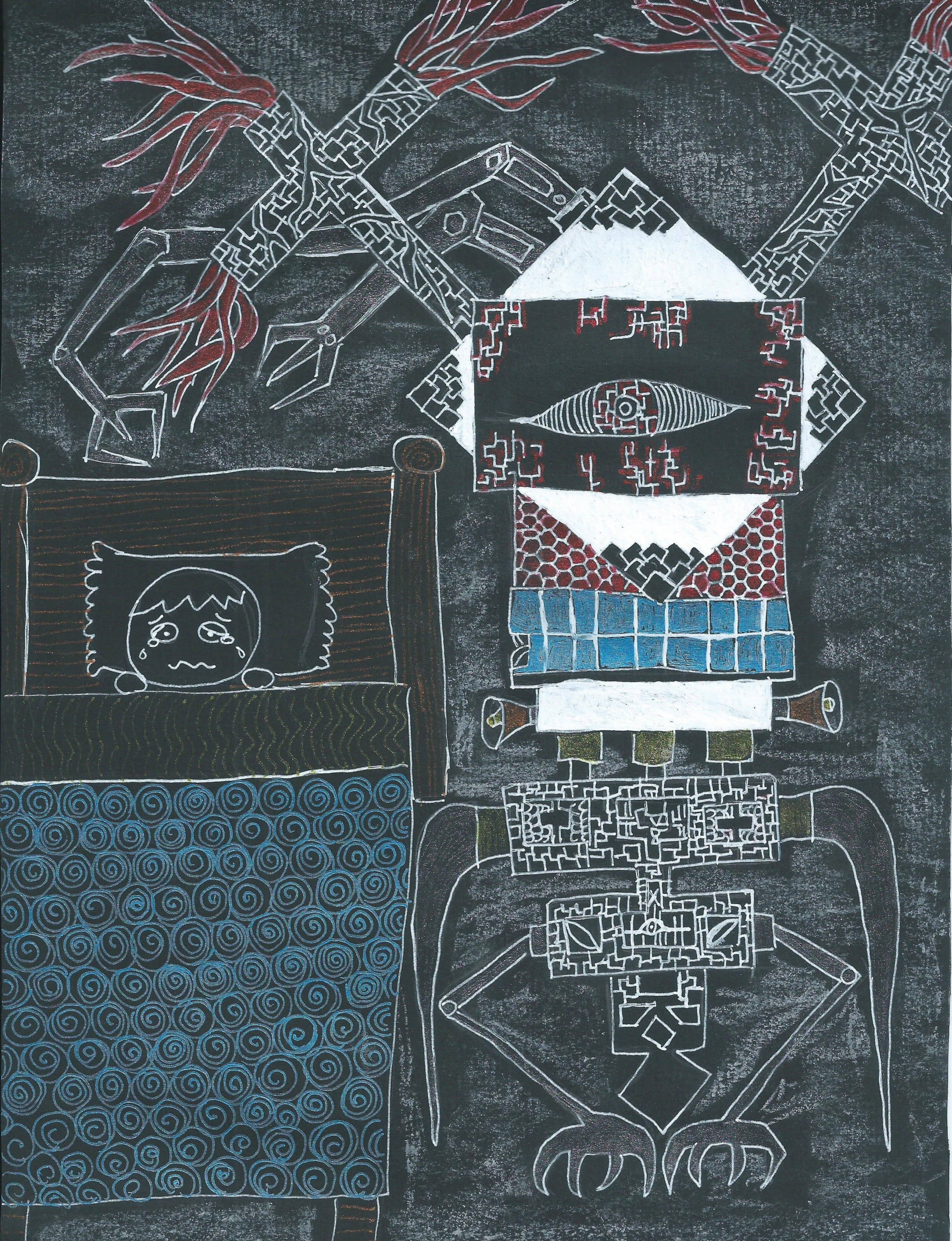
他更恐懼夜晚的來臨