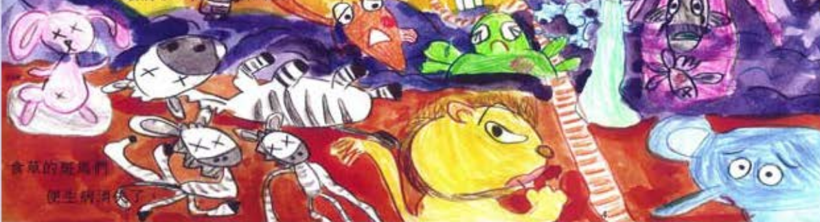
食草的斑馬們 便生病消失了。

獅子和動物們仔細一看，原本清澈的湖水，竟漫流著五顏六色的髒水，各式各樣的瓶瓶罐罐在湖裡載浮載沈，空氣中飄散著陣陣撲鼻的惡臭，魚不游、蝦不動，連平時一派淡定的烏龜索性頭、腳都不探出來打招呼了。上游工廠製造的廢水、家庭排放的汗水和用過即丟的塑化製品，四處污染、到處毒害，魚蝦病了，間接污染草原，